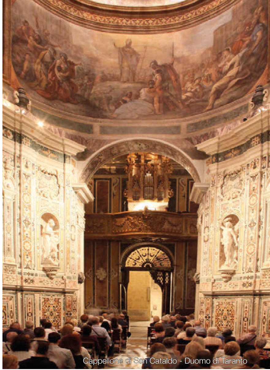
Cappellone di San Cataldo - Duomo di Taranto