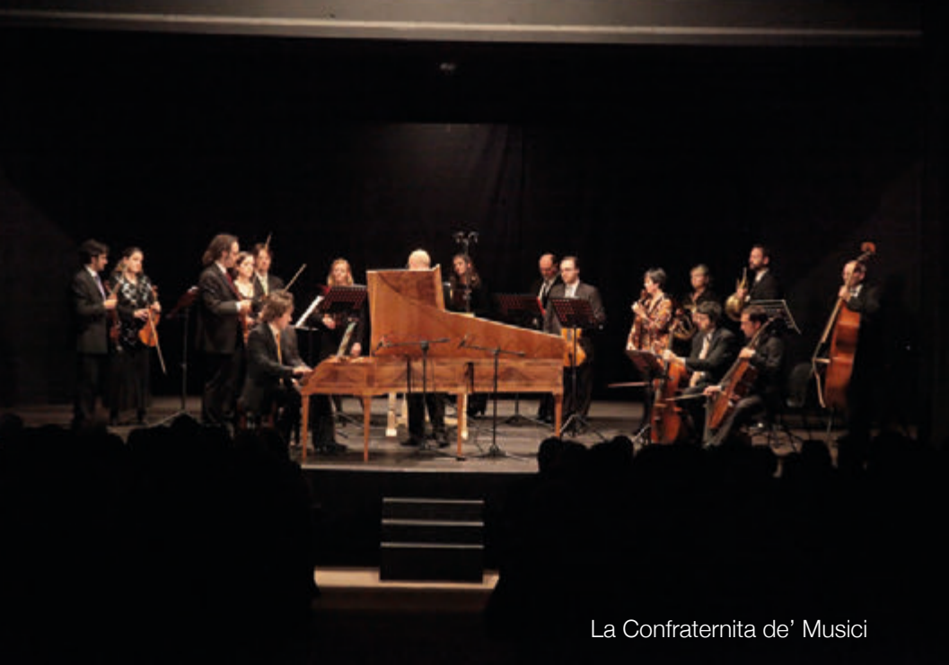
La Confraternita de' Musici