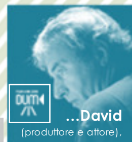
... David (produttore e attore),