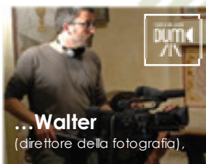
... Walter (direttore della fotografia),