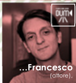
... Francesco (attore),